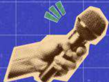
TABLE RONDE 3